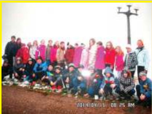
Kirándulás a Tarán

XXI. évfolyam, (42.) 3. szám Kis Ferenc Általános Iskola, Oromhegyes – Orom 2014. nyár