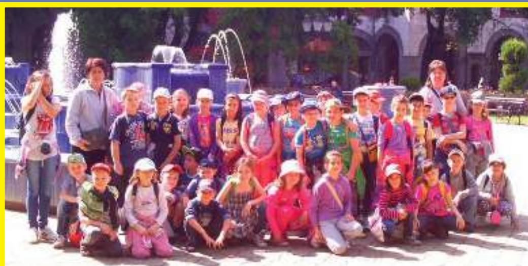
Szabadkán az oromi csapat