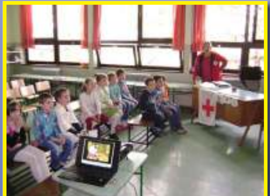
A Vöröskereszt előadása